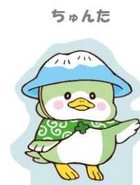
金城大短期大学部 美術学科学生 作品