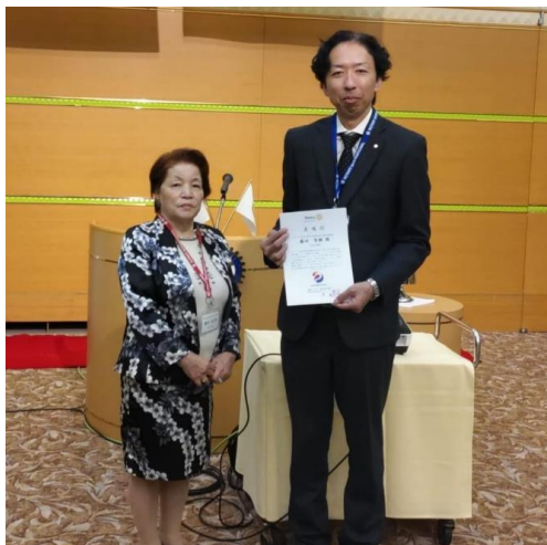
2024学年度ロータリー米山記念奨学生 選考面接委員委嘱状