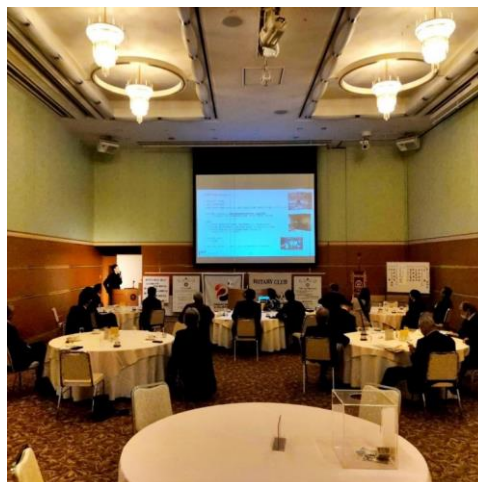
パワーポイントで説明