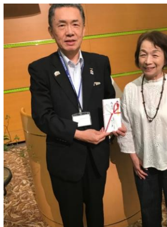
夫人の集いからの寄附