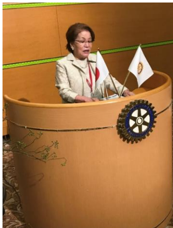
藤本会長 あいさつ