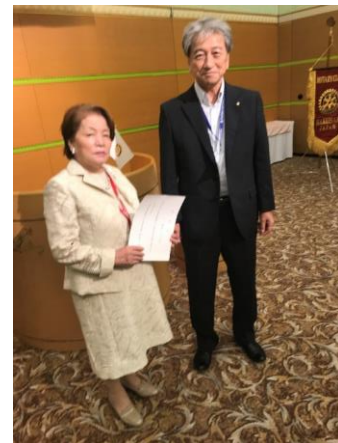
白山市福祉健康まつり実行委員会 委員の委嘱状