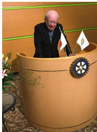
中野委員長から市長のご紹介