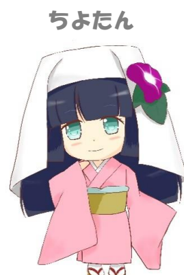
金城大短期大学部 美術学科学生 作品