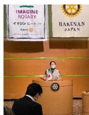
ニコニコBOX 大黒会員