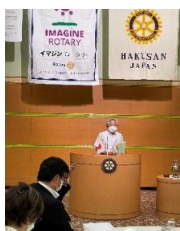
県民割説明 中川会員