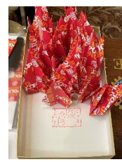
ポリオ撲滅 千羽鶴