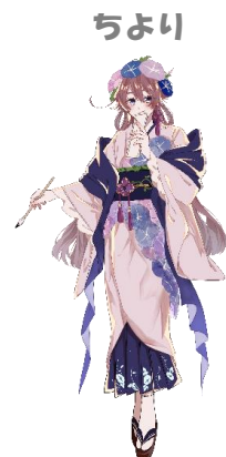
金城大短期大学部 美術学科学生 作品