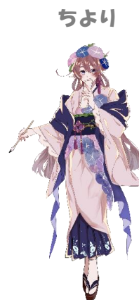
金城大短期大学部 美術学科学生 作品