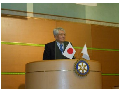
2023-24年度ガバナー候補者推薦について