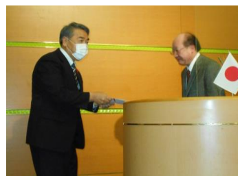
歳末助け合い募金贈呈

この度のご奉仕に重ねて感謝申し上げますとともに、貴クラブの益々のご発展と、皆様のご多幸を祈念し、お礼のご挨拶とさせていただきます。本当にありがとうございました。