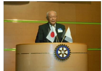
能美RC米山奨学生カウンセラー