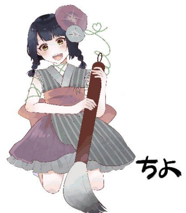
金城大短期大学部 美術学科学生 作品