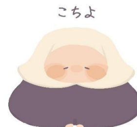
金城大短期大学部 美術学科学生 作品