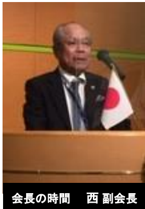
会長の時間 西副会長