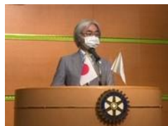
八木会長エレクト