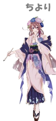
ちより 金城大短期大学部 美術学科学生 作品